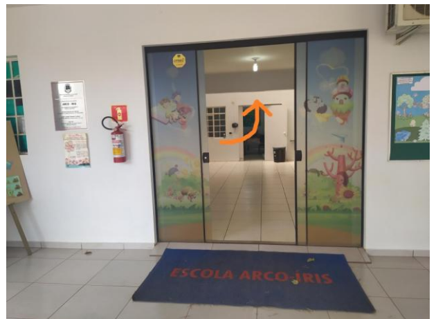
Foto 2: Local aonde se localiza a Clarabóia no Predio em questão (indicado pela seta)- acesso principal e às salas.